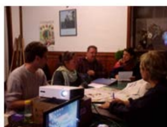
Projection de Diaporama