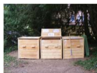
Site de compostage