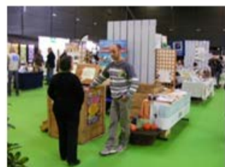
Sensibilisation par un guide composteur