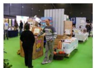
Sensibilisation par un guide composteur