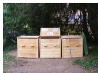
Site de compostage