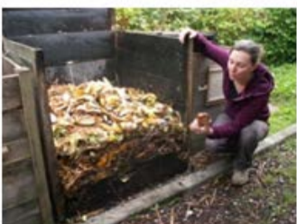
Les différents stades de la décomposition