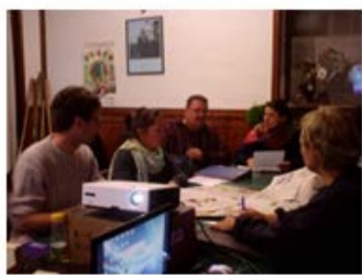
Projection de Diaporama