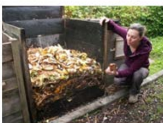
Les différents stades de la décomposition